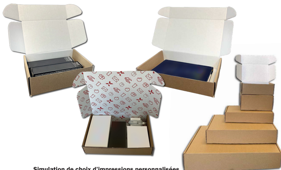
Simulation de choix d'impressions personnalisées